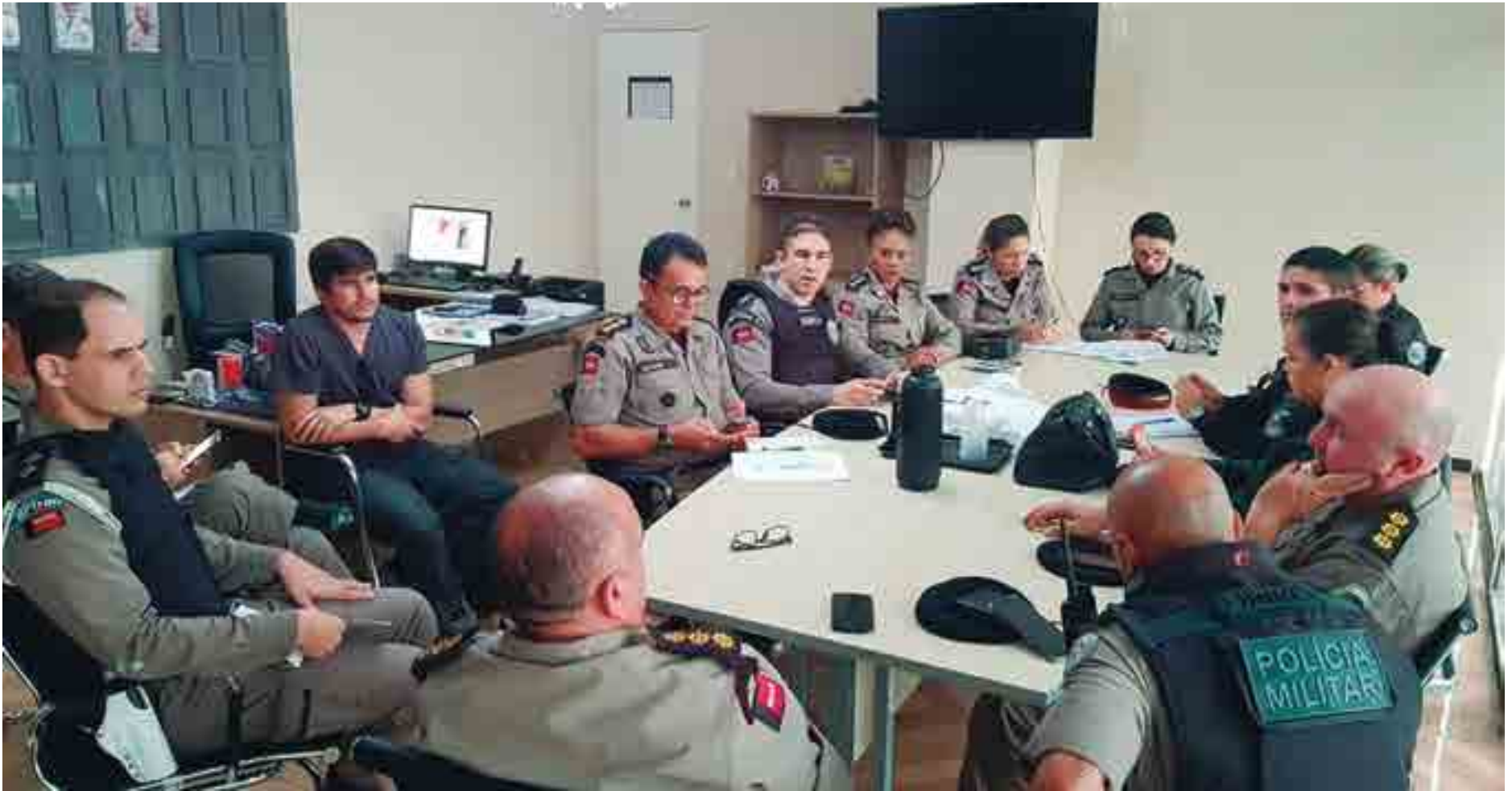
Reunião com o comando da Polícia Militar, em Campina Grande, ocorreu na última segunda-feira e tratou especificamente do jogo decisivo de domingo entre Treze e Botafogo, no Amigão

Outro ponto importante será a utilização do policiamento velado (a paisana). Esse pessoal será responsá-