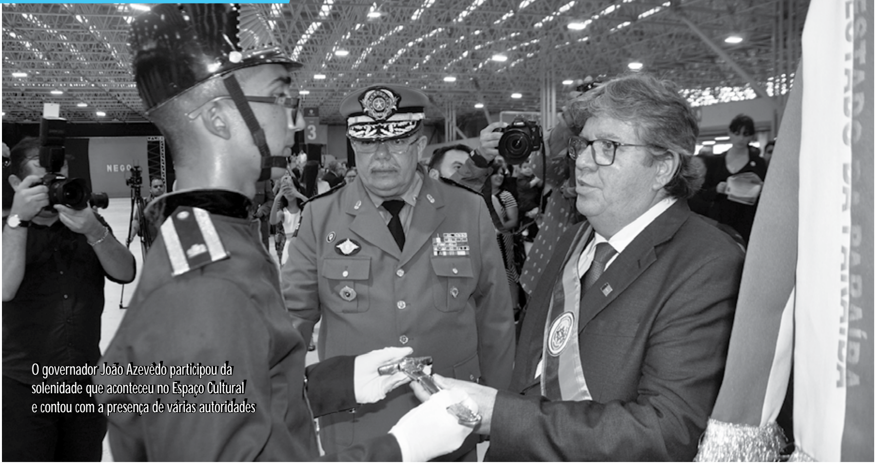
O governador João Azevedo participou da solenidade que aconteceu no Espaço Cultural e contou com a presença de várias autoridades