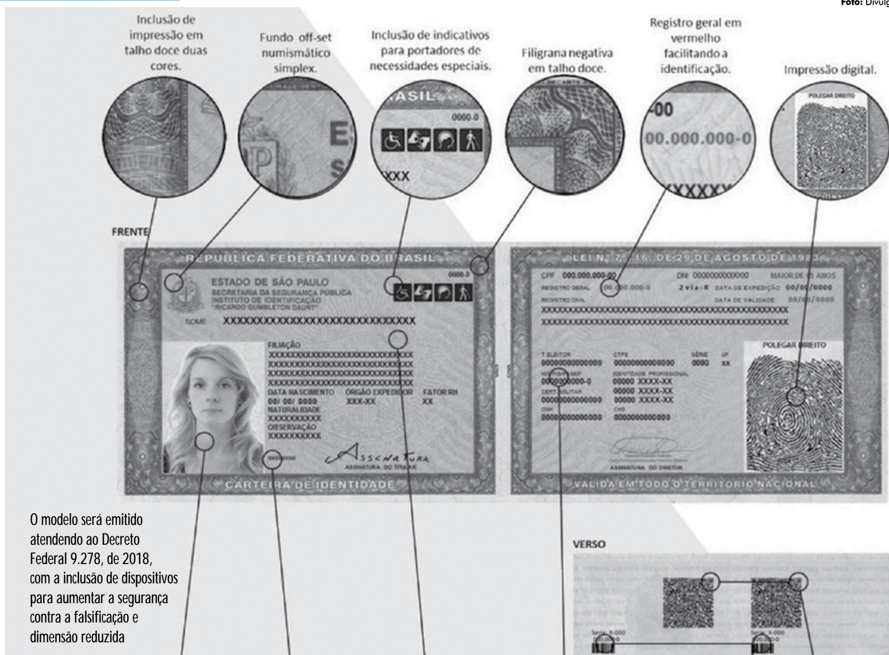
O modelo será emitido atendendo ao Decreto Federal 9.278, de 2018, com a inclusão de dispositivos para aumentar a segurança contra a falsificação e dimensão reduzida

O Ato da presidência estabelece que a participação na Semana Nacional da Conciliação será facultativa, devendo ser formulada pelo magistrado interessado mediante Termo de Adesão, a ser disponibilizado no portal do Tribunal de Justiça, com indicação do maior número possível de feitos aptos à conciliação, de forma a compor a pauta especial de audiências da respectiva unidade jurisdicional.