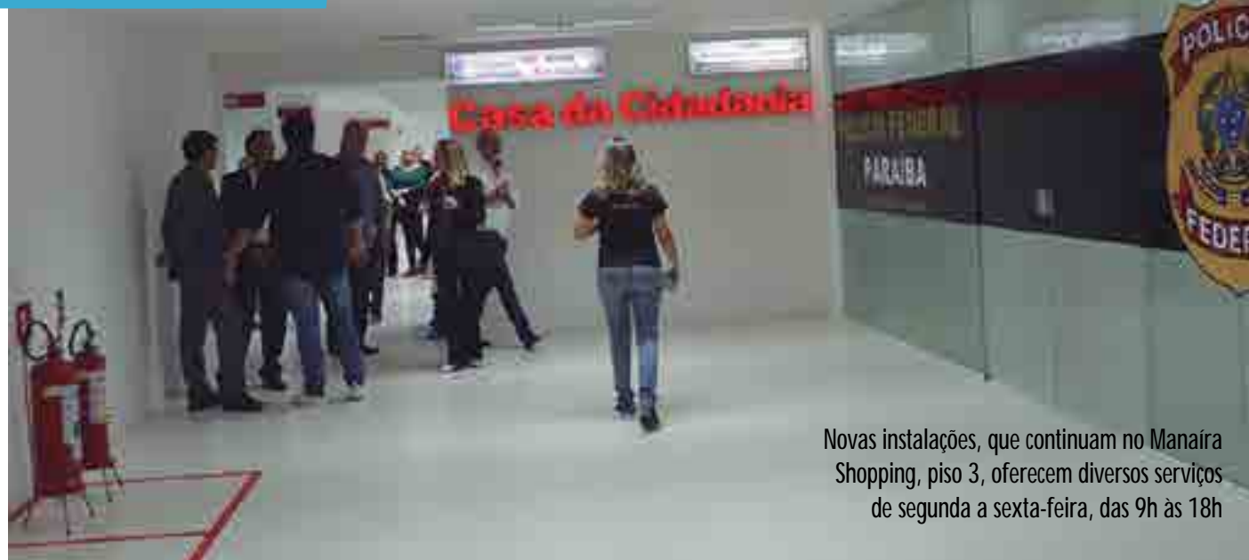
Novas instalações, que continuam no Manaíra Shopping, piso 3, oferecem diversos serviços de segunda a sexta-feira, das 9h às 18h