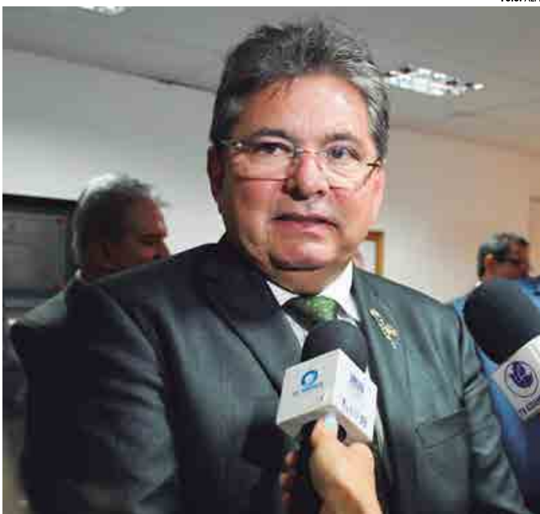
Presidente da Assembleia Legislativa Adriano Galdino (PSB): “Iniciativa atende pleito de três parlamentares da região”

Ele disse que as sessões itinerantes foram decididas desde fevereiro logo depois da posse dos novos deputados e da eleição da Mesa, e não tiveram início desde o primeiro semestre porque o debate da Lei de Diretrizes Orçamentárias e outros temas mais trabalhosos ocuparam demais os deputados.