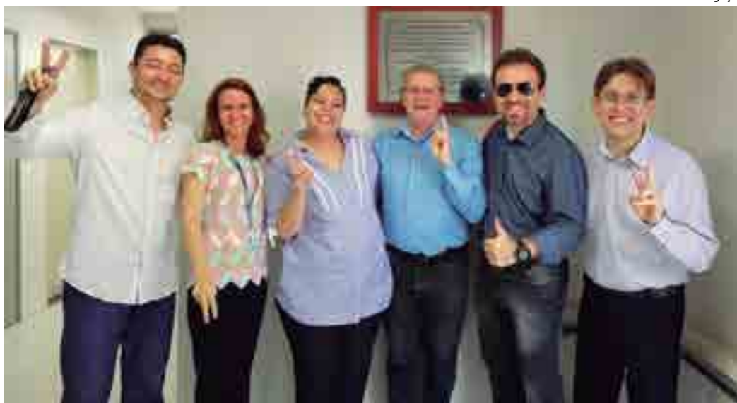
Equipe do Inova-UFPB: trabalho voltado para o desenvolvimento de empresas com bases tecnológicas