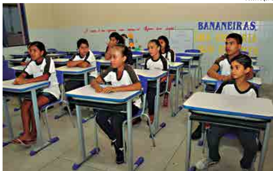
Vários órgãos estarão reunidos para discutir linhas políticas de ações em defesa desta parte da população