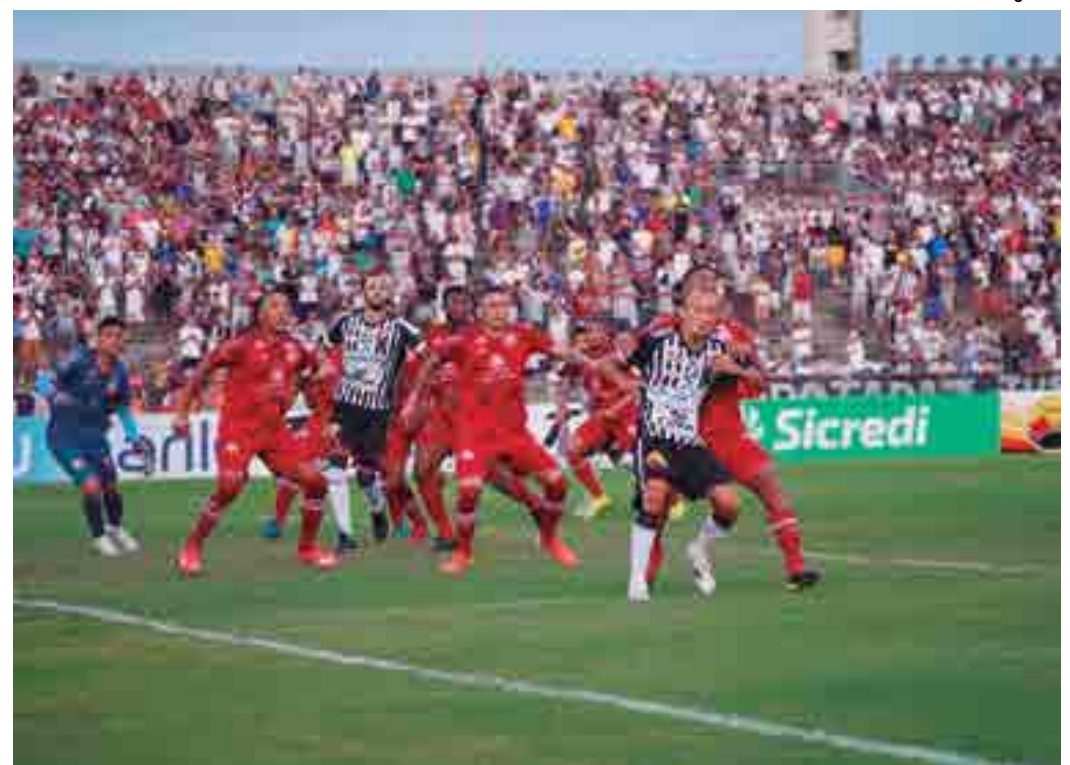
Vindo de uma derrota para o Náutico em casa, o Botafogo precisa vencer e torcer contra adversários no sábado

O técnico Evaristo Piza não poderá contar com o lateral esquerdo Fábio